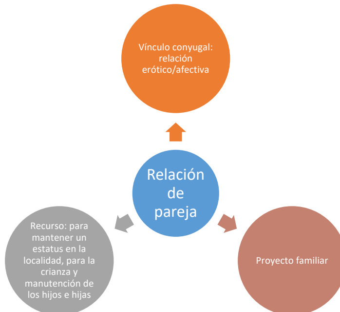
Figura 2. Esquema propuesto sobre el papel de la pareja en la vida de las mujeres.

Para las mujeres entrevistadas, la relación de pareja es importante porque es una relación de amor, cariño y afecto en la que comparten una vida sexual activa. Por otro lado, la pareja desempeña un papel fundamental para el cumplimiento del proyecto familiar puesto que es un proyecto común. Finalmente, ellas consideran que la pareja es también un recurso que puede fungir de apoyo de diferentes formas. A continuación, se propone un esquema (figura 2) para ejemplificar cómo es que estas mujeres conciben la relación de pareja.