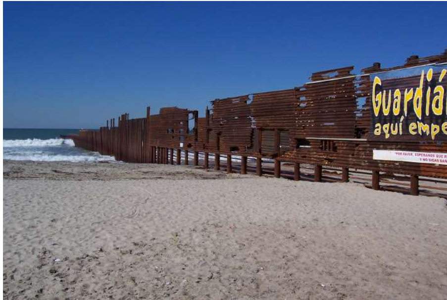
Fotografía 3. Los primeros muros: Playas de Tijuana