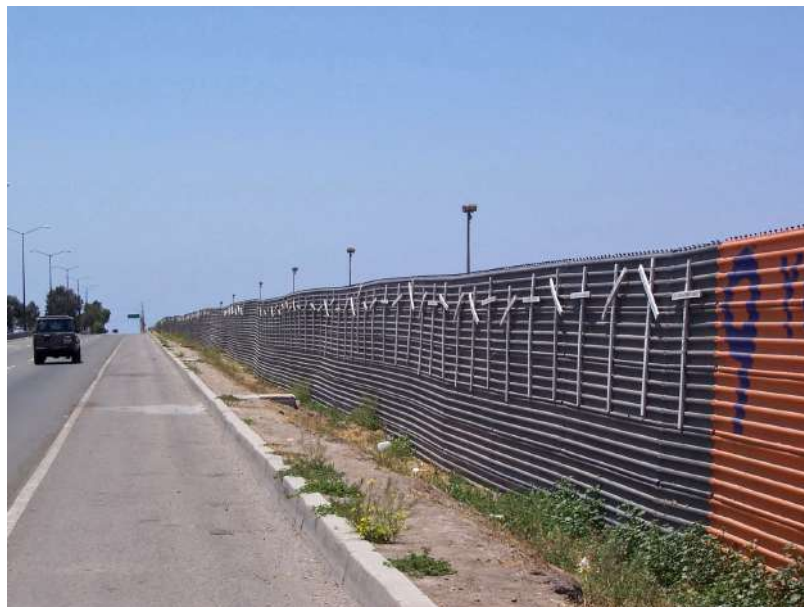
Fotografía 4. Los primeros muros: carretera al aeropuerto

Fuente: Archivo personal, Tijuana, 2004.