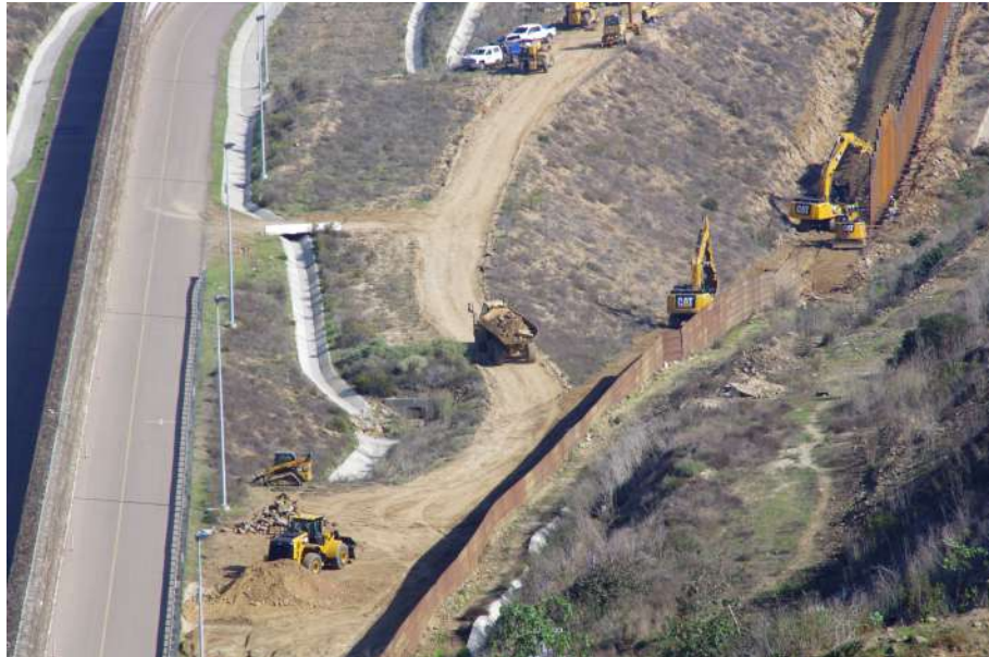
Fotografía 6. Sustitución de la vieja barda en el cañón de Los Laureles