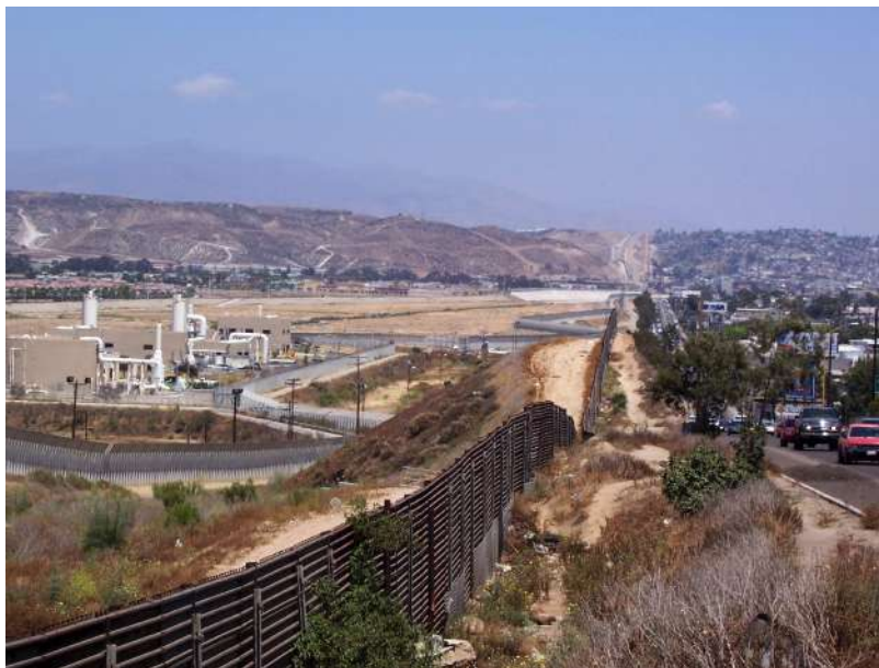
Fotografía 1. Doble barda en la Avenida Internacional, construidas en 2004