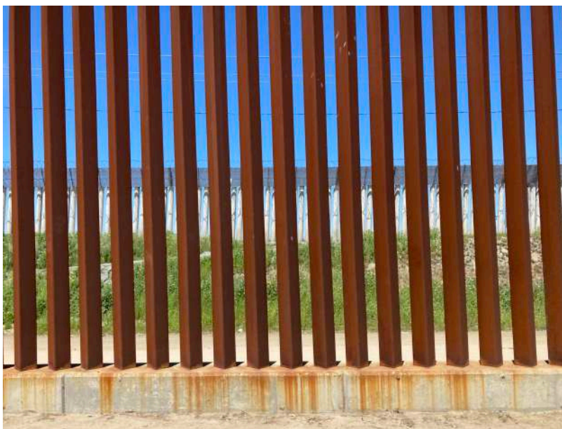
Fotografía 5. Tramos con doble muro: Avenida Internacional